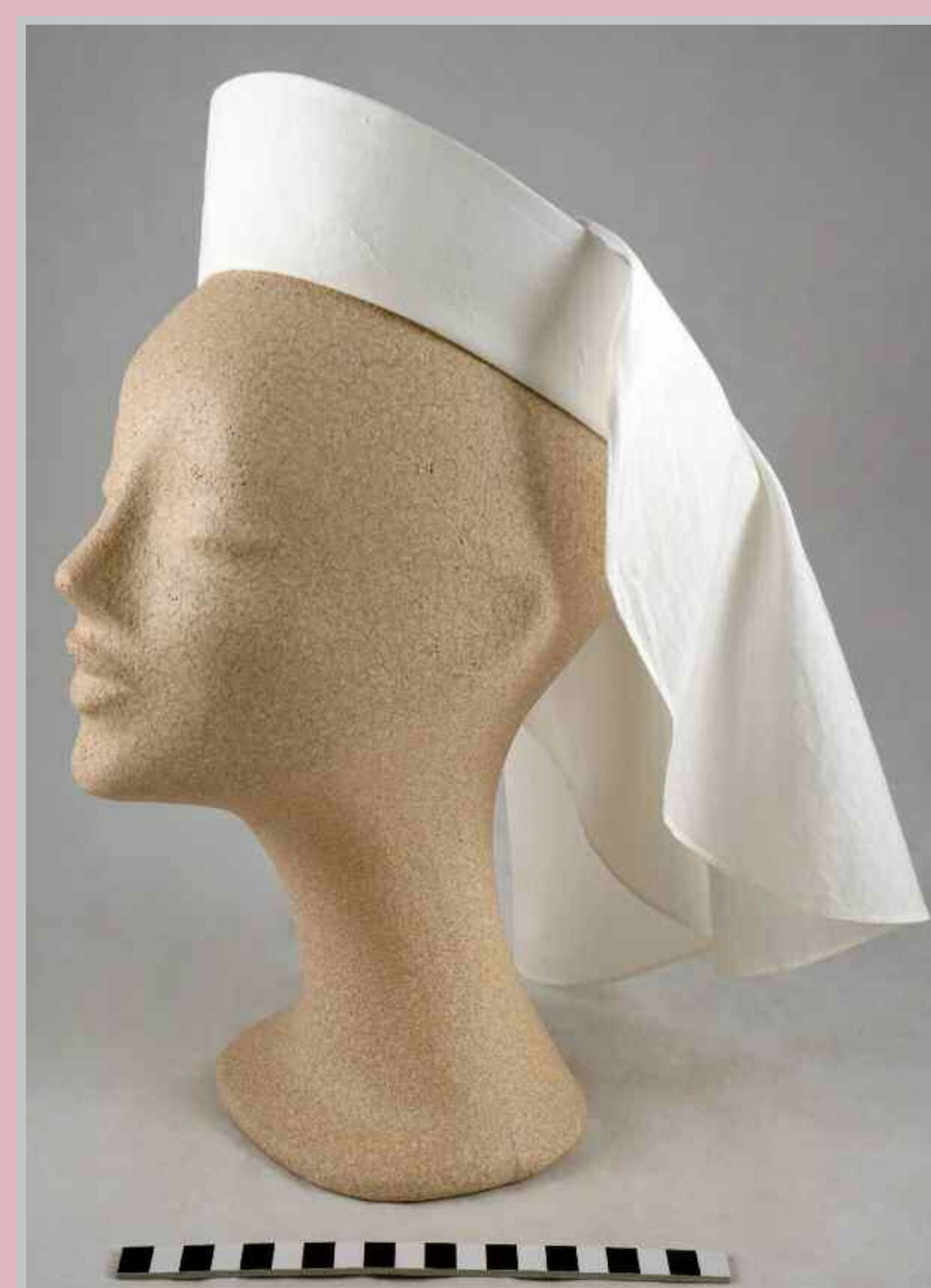
Huntu oli osa kätilön työasua 1920-luvulta alkaen, hilkka vakiintui käyttöön hieman myöhemmin ja molempia käytettiin aina 1970-luvulle saakka. Kätilöopiskelijat taas käyttivät vain hilkkaa, jonka siniset raidat kertoivat kätilöopiskelijan opiskelijan vuosikurssin. Hunnun ja valkoisen hilkan sai käytöön opintojen valmistuttua. Kuvan huntu ja hilkka ovat Länsi-Uudenmaan sairaalamuseosta. Huvudduken hörde till barnmorskans uniform från och med 1920-talet, medan hättan togs i bruk lite senare. Båda användes ända fram till 1970-talet. Barnmorskestudenter använde bara hättan. Den var försedd med blå ränder som avslöjade studentens årskurs. Huvudduken och den vita hättan fick man börja använda efter examen. Bildens huvudduk och hättan är från Västra Nylands sjukhusmuseum.