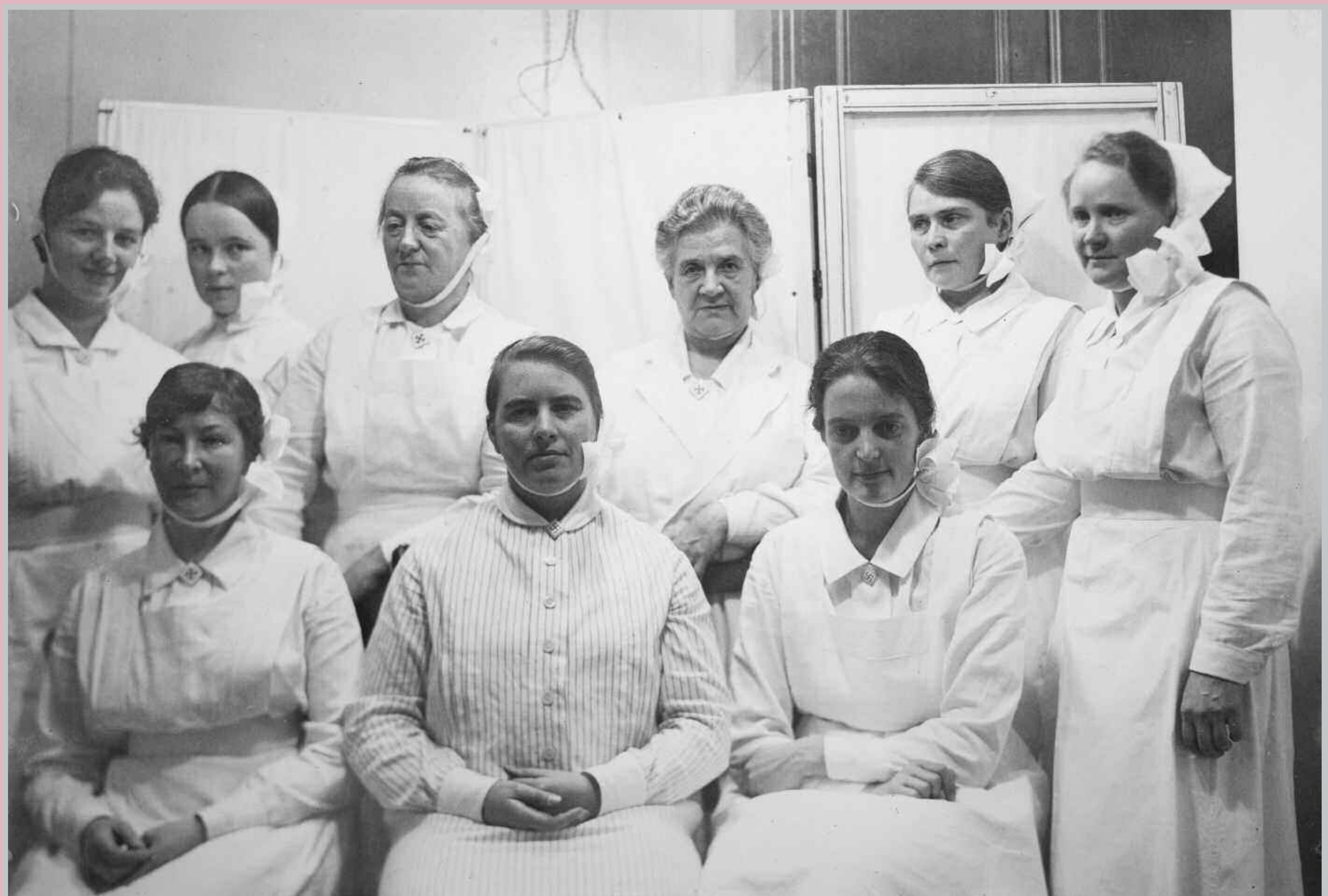
Vuosina 1911–1937 sairaanhoitajan univormuun kuului valkoisesta kankaasta taiteltu mysky, joka pysyi paikoillaan rusettimuhan avulla. Päähineen käyttö perustui muotiin ja käytäytymissääntöihin, sillä 1800-luvulta 1900-luvun puoliväliin saakka ei ollut sopivaa esiintyä ilman päähinettä kodin ulkopuolella. Kuvassa Lastenklinikan hoitajia.