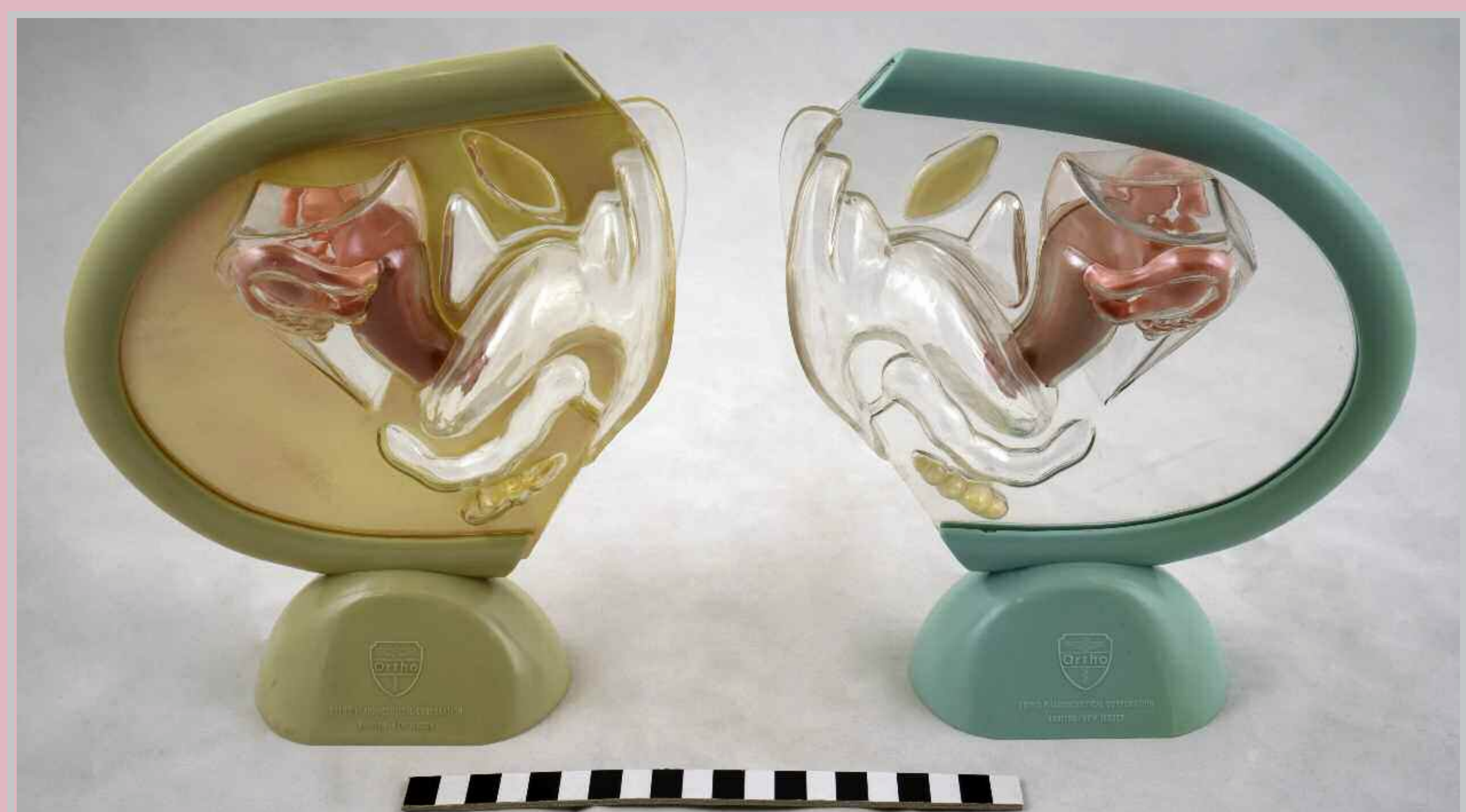
Kättilö on terveyskasvatuksen ja -neuvonnan ammattilainen, jonka osaamiseen kuuluvat naisen terveys, seksuaaliterveys ja naistentaudit. Kätilöitä työskentelee niin perusterveydenhuollossa, äitiyspoliklinikoilla, synnytysosastoissa, lapsivuodeosastoilla, naistentautiosastoilla kuin lapsettomuusklinikoilla. Kuivassa naisen sukupuolielinten havaintomallit Naistenklinikalta. Barnmorskor är experter på hälsöfostran och -rådgivning. Deras kompetens täcker kvinnohälsa, sexuell hälsa och kvinnosjukdomar. Barnmorskor arbetar inom barnhälsovården och i förlossningsälsalar samt på mödrapolikliniker, BB-vårdavdelningar, kvinnosjukdoms avdelningar och barnhälsoetskliniker. Bildens modeller av de kvinnliga könsorganen är från Kvinnoklinikens.