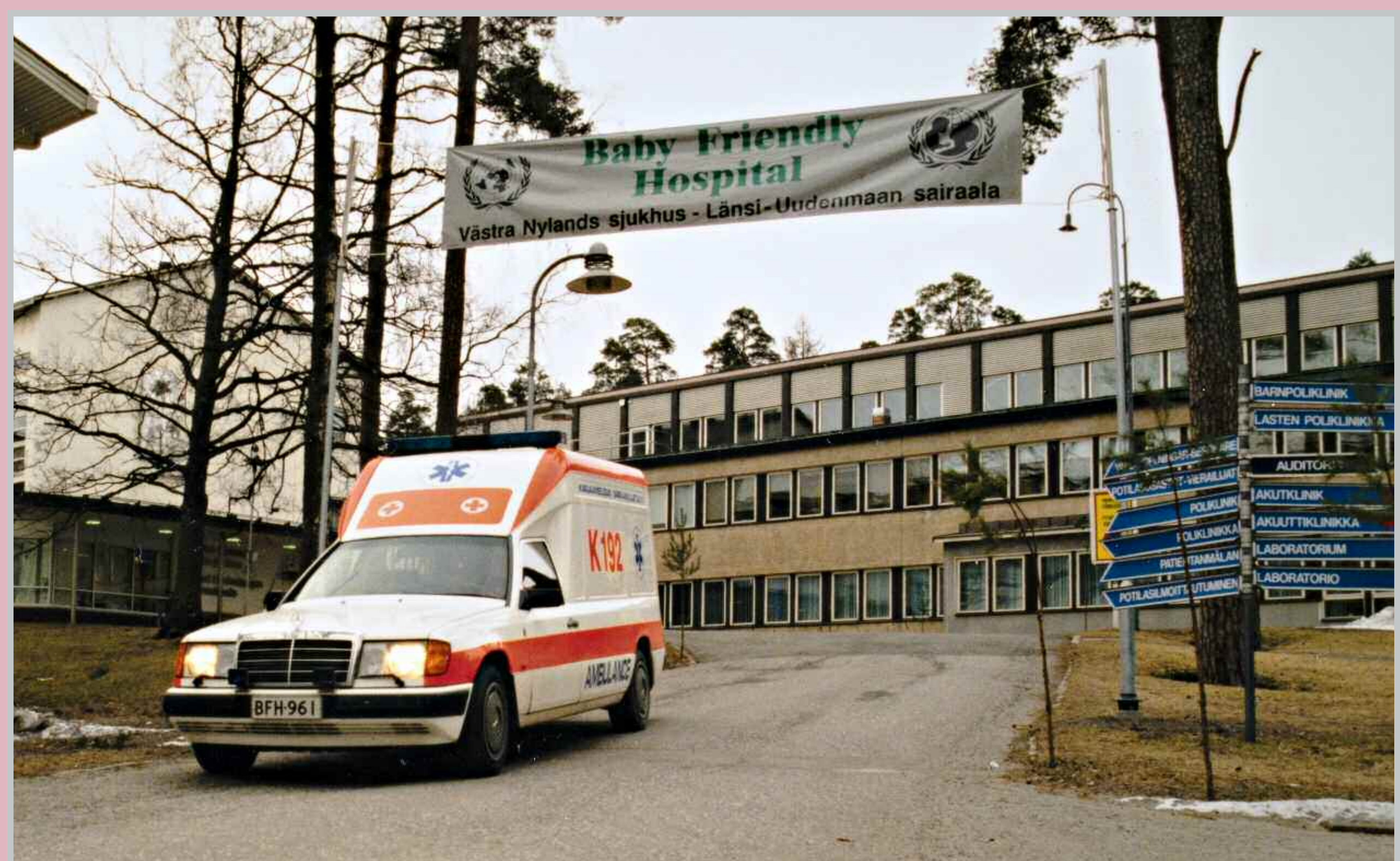
Kaikkia HUSin synnytyssairaaloissa on sitouduttu WHO:n ja Unicefin imetyksen edistämisen toimintaohjelmaan eli vauvayönteisyys-ohjelmaan. Ohjelman mukaiset hoitokäytännöt mahdollistavat imetyksen käynnistämisen parhaalla tavalla. Länsi-Uudenmaan sairaalan synnytysosastolle myönnettiin vuonna 1996 vauvayönteisyysertifikaatti ensimmäisenä Suomessa. Alla förlossningssjukhus inom HUS har förbundit sig till WHO:s och Unicefs verksamhetsprogram för främjande av amning, det vill säga programmet för ett babyvänligt sjukhus. Programmet värdepriisat möjliggör att amningen kommer i gång på ett optimalt sätt. Västra Nylands sjukhus blev år 1996 det första sjukhuset i Finland som certifierades som babyvänligt.