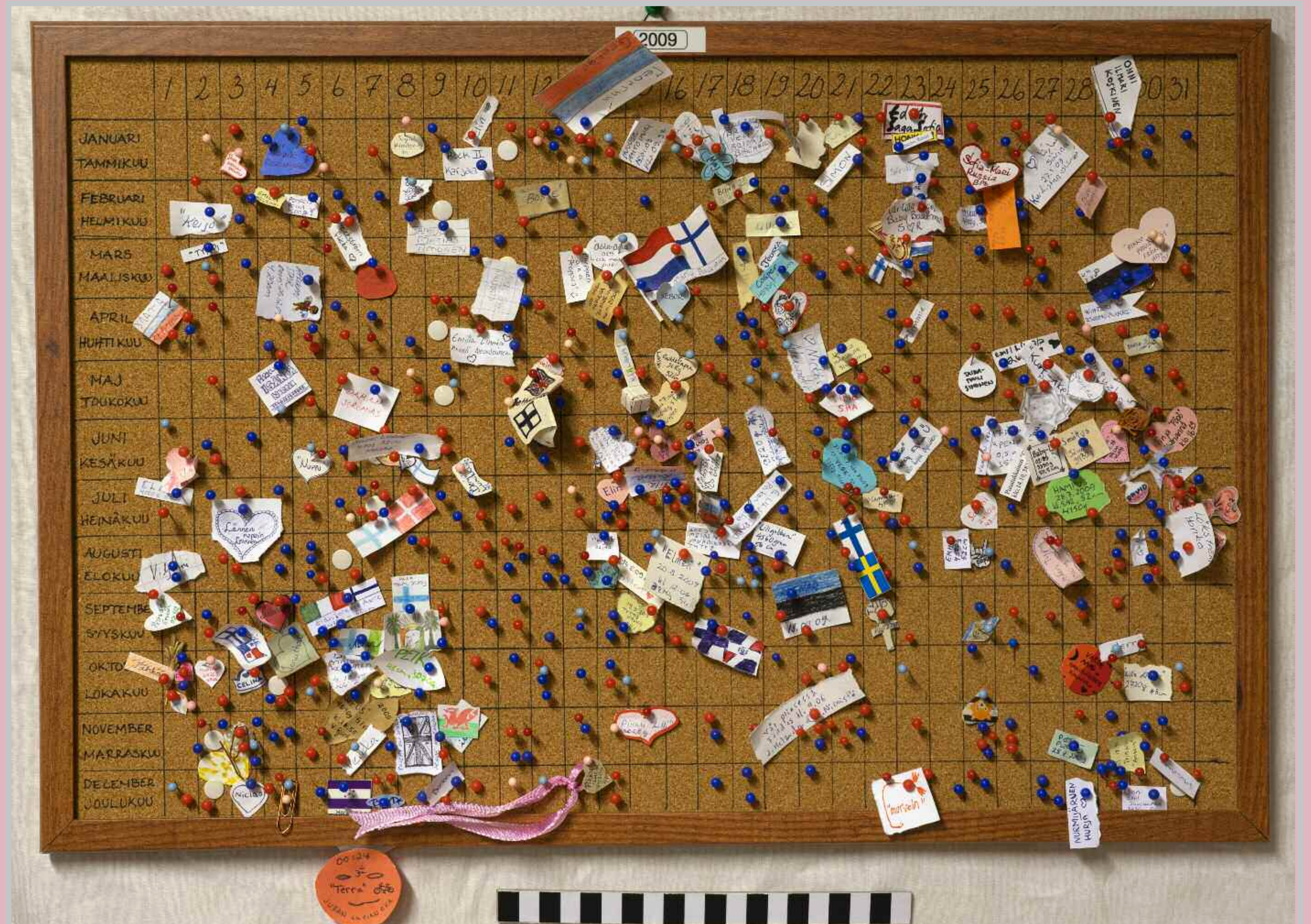
Länsi-Uudenmaan sairaalamuseon kokoelmaan on talletettu tauluja, joihin on merkitty nastoilla kaikki vuoden aikana osastolla syntyneet lapset. Punainen = tyttö, vaaleanpunainen = sikiötyttö, sininen = poika, vaaleansininen = sikiöpoika, liitin = kaksoset, nasta = täysikuu. Västra Nylands sjukhusmuseums samling har det bevarats anslags tavlor på vilka alla barn som föts på avdelningen under årets lopp markerats med ett stift. Röd - flicka, ljusröd - flicka med snit, blå - pojke, ljusblå - pojke med snit, gem - tvillingar (gemini), häftstift - fullmåne.