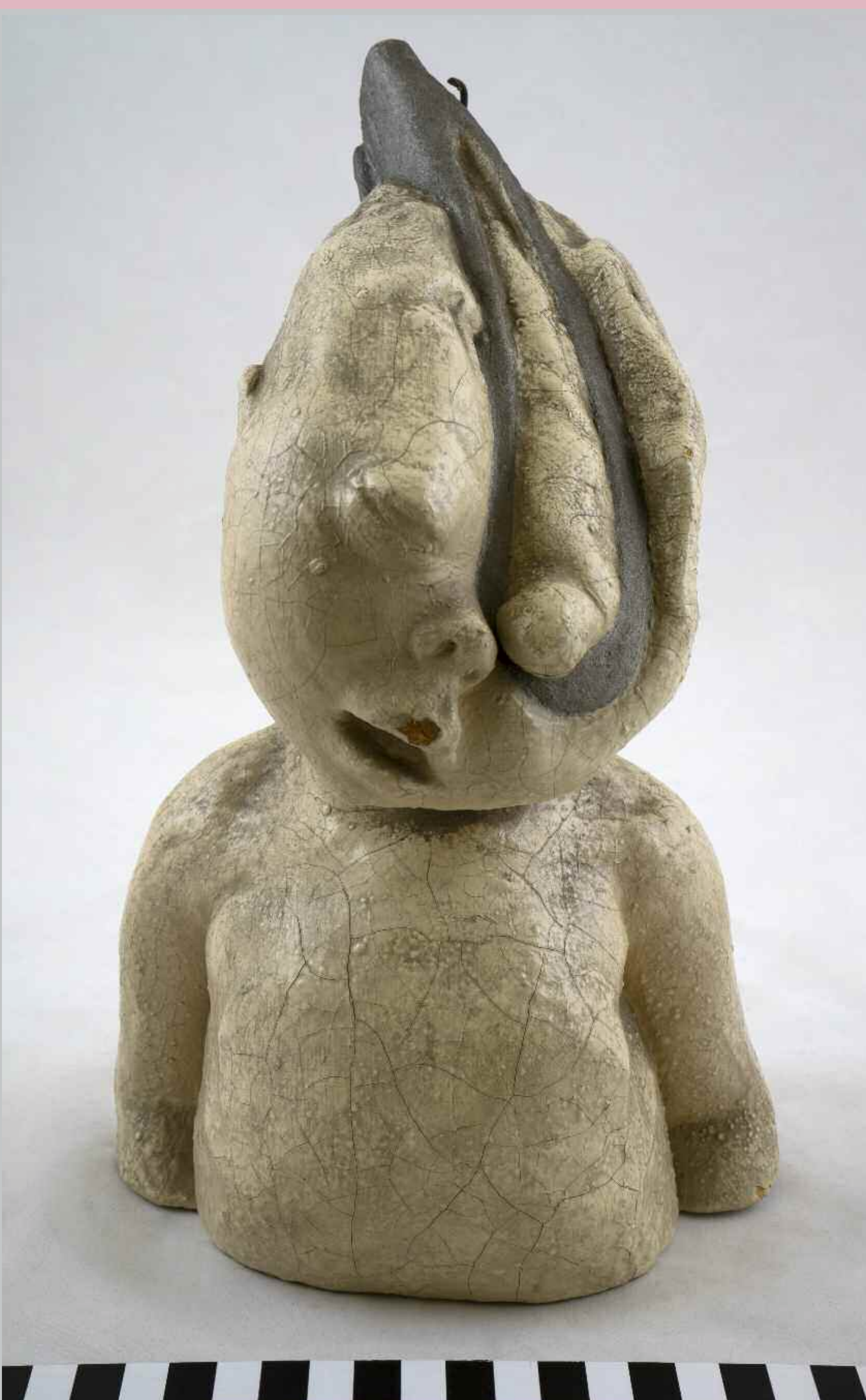
Synnytysspihdit kuuluivat kätilön instrumentteihin 1900-luvun alussa. Synnytysten siirtyessä kodeista sairaaloihin siirtyi pihitönnäytys ensin lääkäreiden vastuulle, ja vähitellen imukuppi ja keisarileikkaus syrjäyttivät pihitönnäytteen. Naistenklinikkan kokoelmaan kuuluva havaintomalli esittää pihitönnäytöksessä vaurioitunutta vauvaa. Förlossningstängen hörde till barnmorskans instrument i början på 1900-talet. När födselarna började ske på sjukhus tog läkarna över ansvaret för tångförlossningarna, och så småningom ersattes förlossningstängen av sugklockan och kejsarsnittet. Modellen av ett spädbarn som skadats av en förlossningstäng hör till Kvinnoklinikens samling.