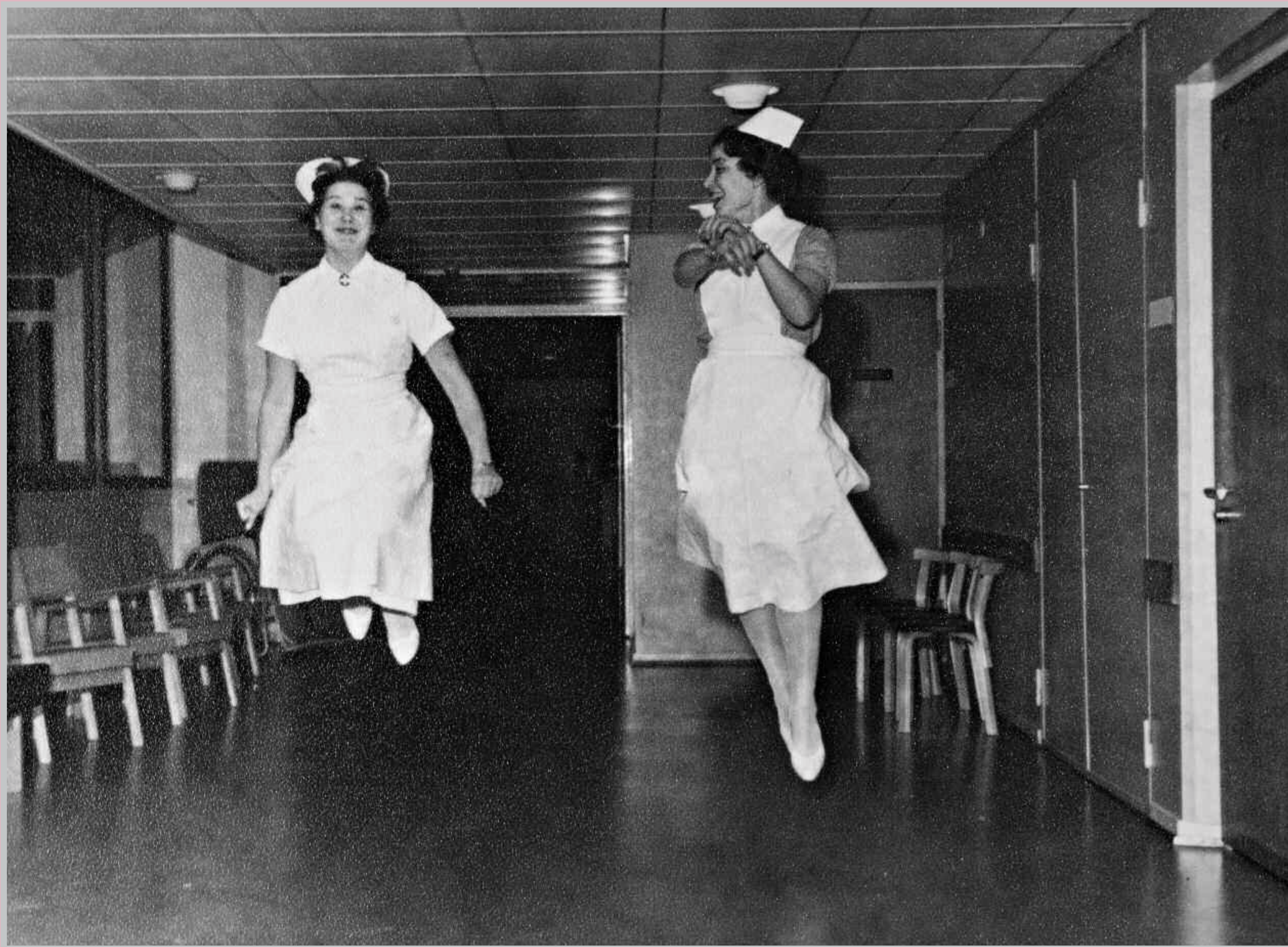
Kollegat ja hyvä työilmapiiri ovat tärkeä voimavara, mutta hoitotyö ei ole ruusuilla tanssimista. Haasteita ovat muun muassa hoitajakato ja työn tehostamisen mukanaan tuoma kiire.

En platt hierarki och en samarbetskultur är också vad som eftersträvas i magnetsjukhusmodellen, som är ett internationellt kvalitetsystem och ett erkännande för utmärkt vårdarbete. Magnetsjukhuset är avsett att vara en attraktiv arbetsplats, som likt en magnet attraherar sjukskötare och håller dem nöjda. Cancercentrum, Hjärt- och lungcentrum, Sjukvård för barn och unga samt Psykiatricentrum är HUS första resultatenheter som ansöker om status som Magnetsjukhus.