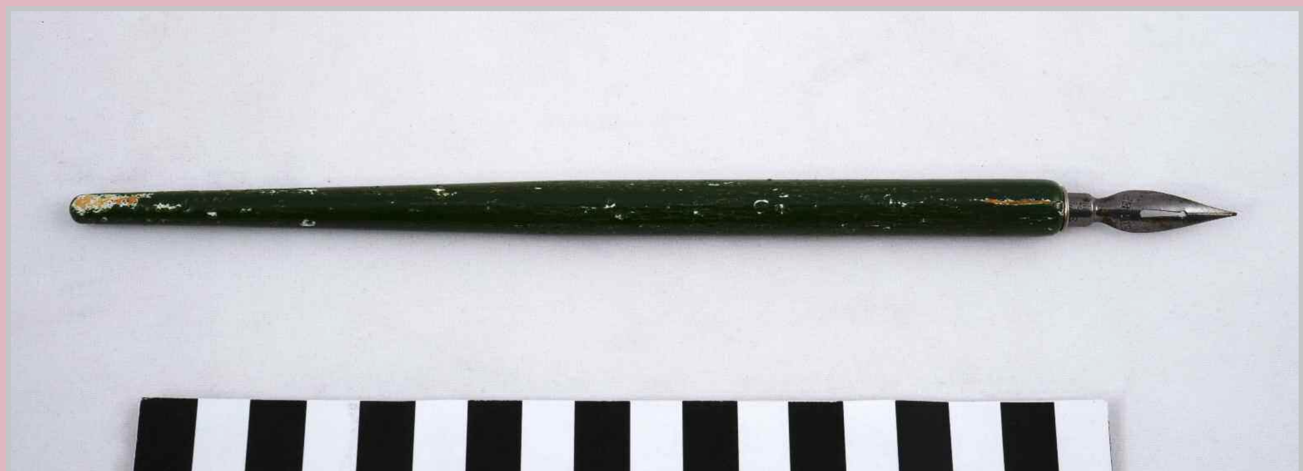
Sulkakynä oli 1800-luvun puolivälissä väistymässä teollisesti valmistetun teräskärkisen kynän tieltä, mutta molempia käytettiin vielä rinnakkain. Nightingalen isä halveksi uusia kyniä ja kirjoitti vain sulkakynällä, mutta Florence itse suosi teräskärkistä kynää. Kuvan kynä on Kellokosken sairaalamuseon kokoelmasta. I mitten på 1800-talet var fjäderpennan på väg att bli ersatt av den industriellt tillverkade stålpennan, men båda användes ännu sida vid sida. Nightingales far föraktade de nya pennorna och skrev endast med fjäderpenna, men Florence föredrog stålpenna. Pennan på fotot är från Kellokoski sjukhusmuseums samling.

/ Utdrag från ett brev, där Florence Nightingale beskriver hur den brittiske generalkonsulen i Egypten stjäl hennes penna.