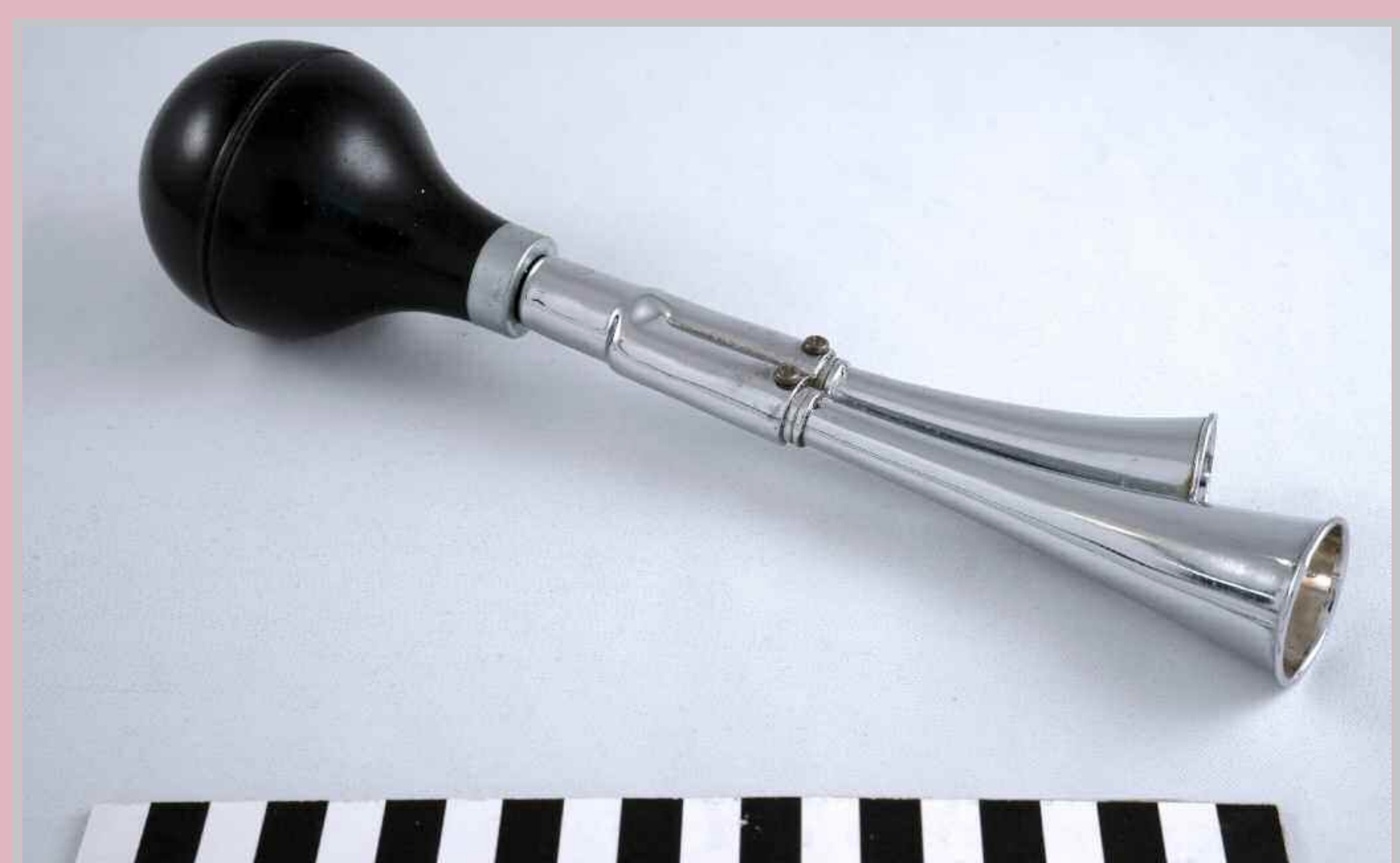
Pyörän torvella on testattu vastasyntyneiden kuuloa Lohjan sairaalassa. Cykeltutan har använts för att testa nyföddas hörsel vid Lojo sjukhus.