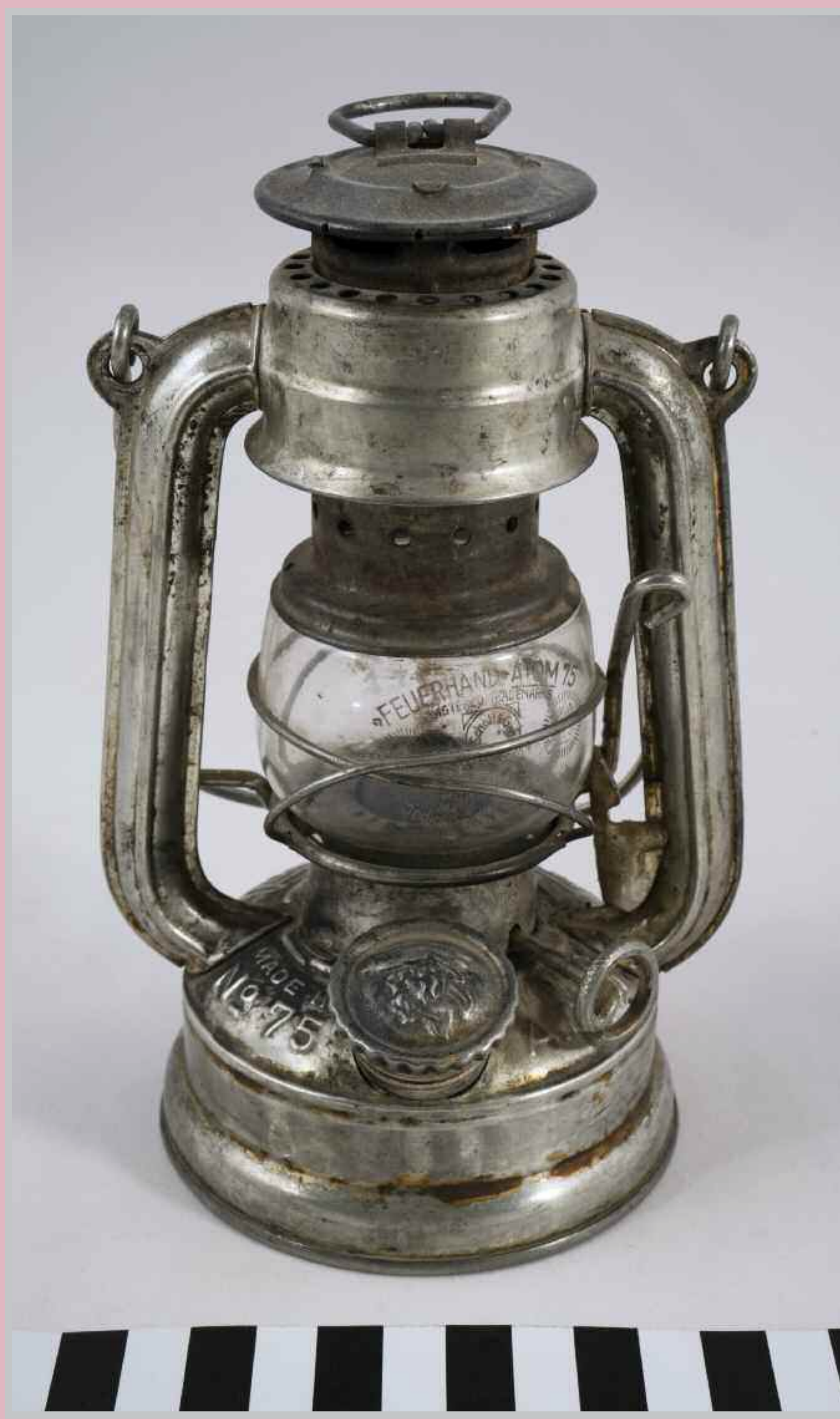
Florence Nightingale kuvataan taiteessa usein öljylamppu tai myrskylyhty kädessään. Hänen kuitenkin tiedetään käyttäneen Krimillä viereisen sivun muotokuvassa kuvattua turkkilaista fanoosilyhtyä. Kuvan myrskylyhty on Kellokosken sairaalan kokoelmasta. Florence Nightingale avbildas ofta med en oljelampa eller en stormlykta i handen. Lampan hon använde på Krim var dock en turkisk "fanoos"-lykta, lik den som är avbildad på porträttet på sidan bredvid. Stormlyktan på fotot är från Kellokoski sjukhusmuseums samling.

Pennan var Florence Nightingales viktigaste arbetsredskap, och hon sägs ha skrivit cirka 13 000 brev. Hon hade regelbunden kontakt med bland annat drottning Viktoria. För sitt livsverk belönades Nightingale år 1907 som första kvinna med inträde i den prestigefyllda Förtjänstorden.