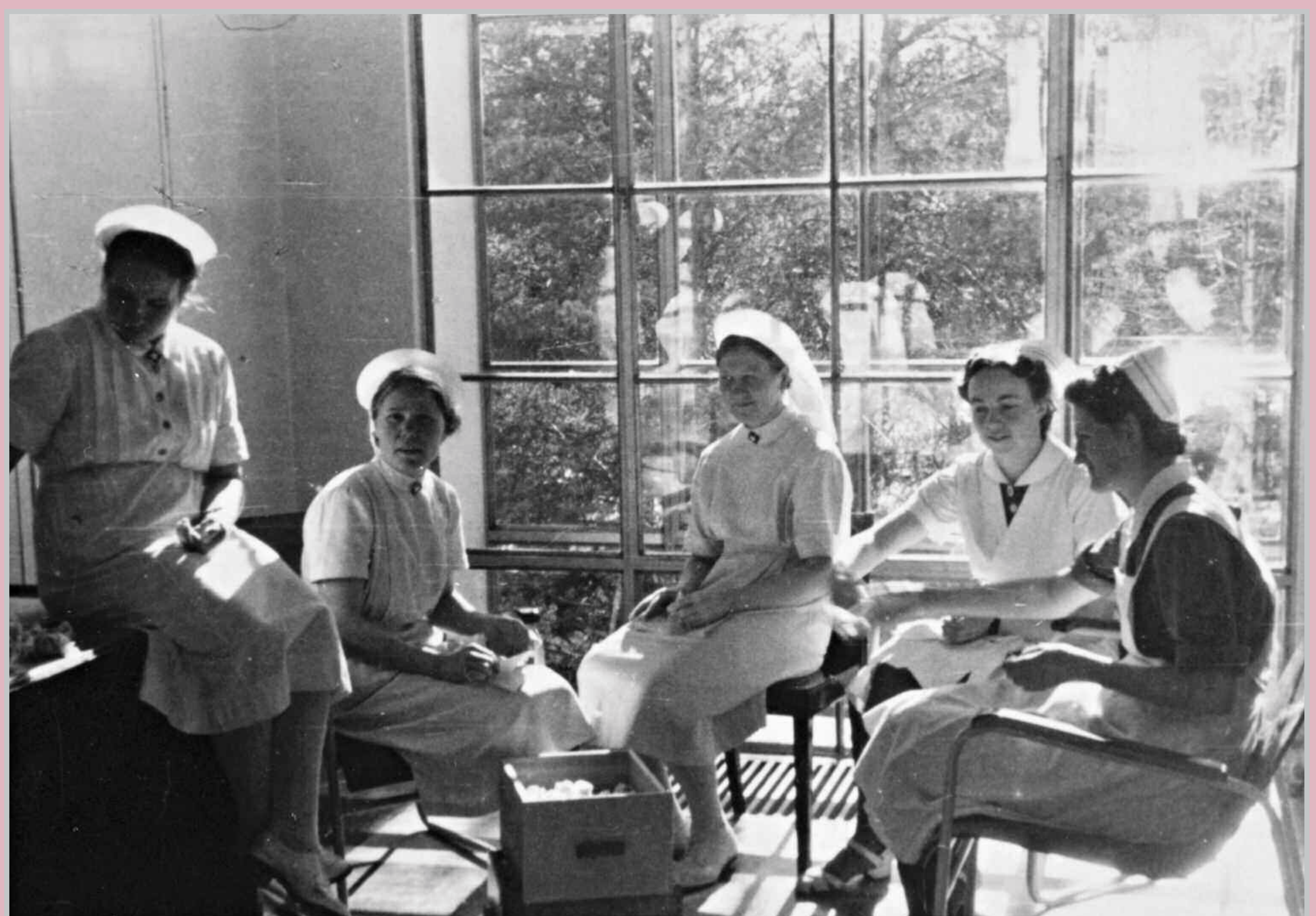
Naistenklinikin kätilöt ja opiskelijat käärinnässä siteitä. Oikealla istuu opiskelija, jonka hilkan nauhat kertovat opiskelijan olevan toisella vuosikurssilla. Keskellä istuu kätilö huntuineen.

Barnmorskor och studenter rullar förband på Kvinnokliniken. Till höger sitter en andra årets student, vilket avslöjas av ränderna på hättan. I mitten sitter en barnmorska med huvudduk.