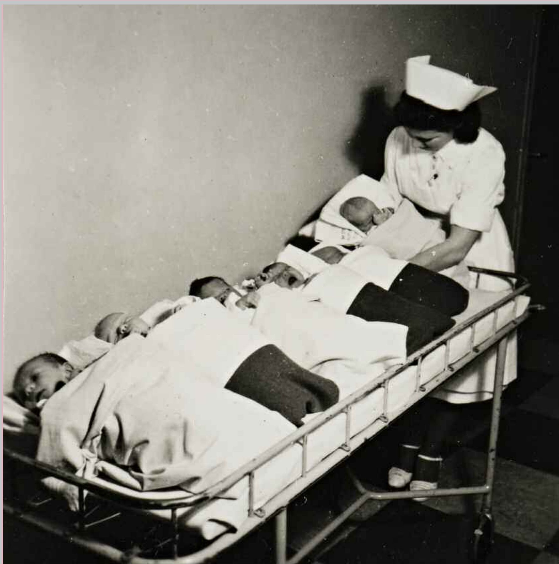
Suuret ikäluokat kuljetettiin Naistenklinikkan suurella vauvavaunulla äitien luo syömään. Vid måndags transporterades de stora årskullarna till sina mammor med Kvinnoklinikens stora babyvagn.

Från och med 1700-talet avlades en barnmorske-ed efter avslutad utbildning. På 1920-talet byttes eden ut mot en barnmorskeförsäkran, som avskaffades först på 1970-talet.