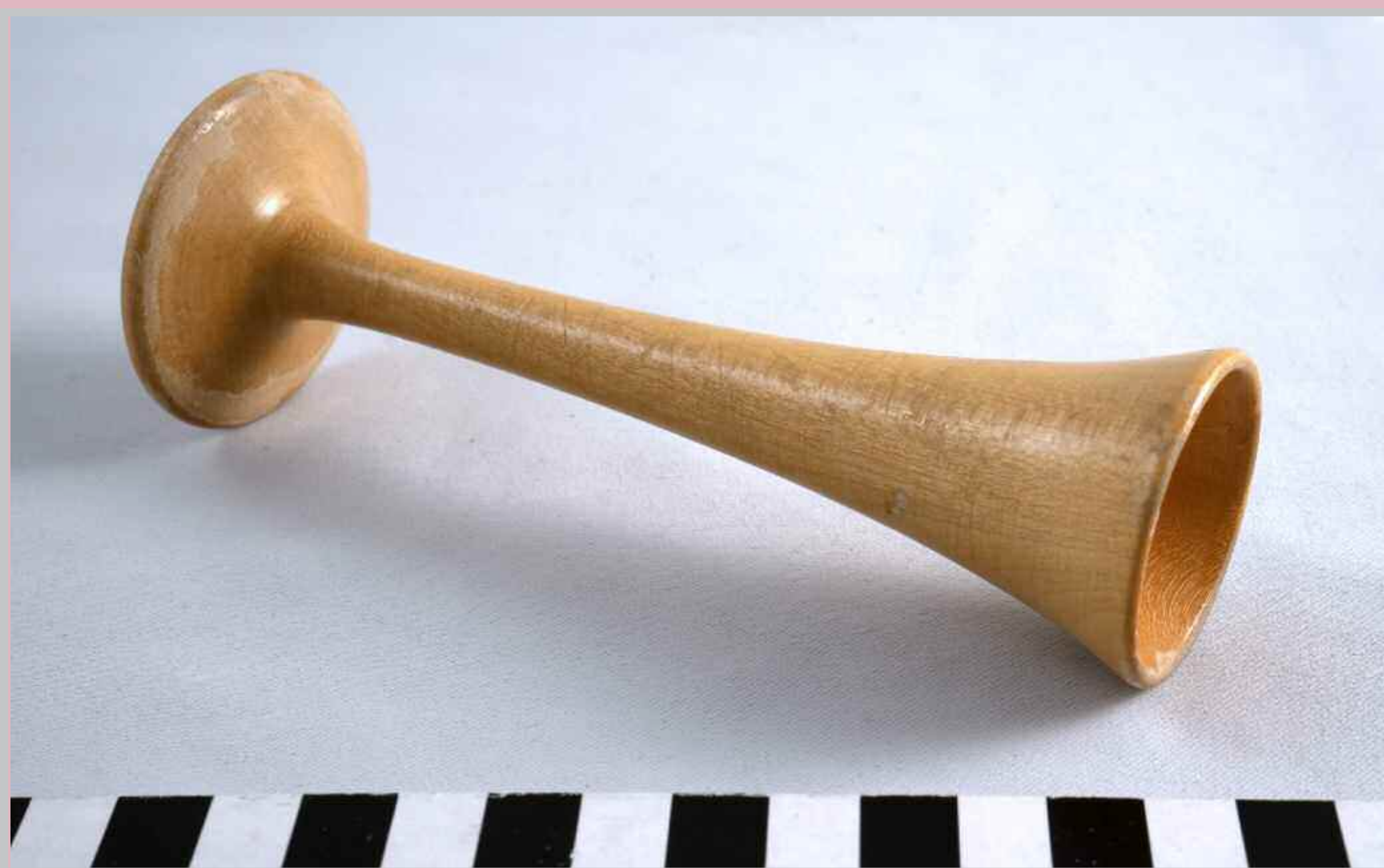
Sairaaloissa siirryttiin puusta sydäntään kuuntelutorvesta metalliseen hygienian parantamiseksi. Kuuntelortia on käytetty Porvoon sairaalassa, jonka synnytysosasto lakkautettiin vuonna 2016. Monet kätilöt käyttävät edelleen kuuntelortia sikin sydäntään kuuntelun.

Dagens barnmorska är professionell inom hälsorådgivning och hälsofostran samt vårdar och ger råd till kvinnor och familjer under graviditeten, födseln och barnsängstiden. Till barnmorskans kompetensområden hör kvinnosjukdomar, kvinnohälsa och barnvård. I Finland tar det fyra och ett halvt år att utbildas till barnmorska. Det är den längsta yrkeshögskoleutbildningen inom hälsovården, och utbildningen ger också sjukskötarbehörighet. Barnmorskeutbildningen i Finland är mera omfattande än i många andra europeiska länder, eftersom den finländska barnmorskan även är en expert på sexuell hälsa.