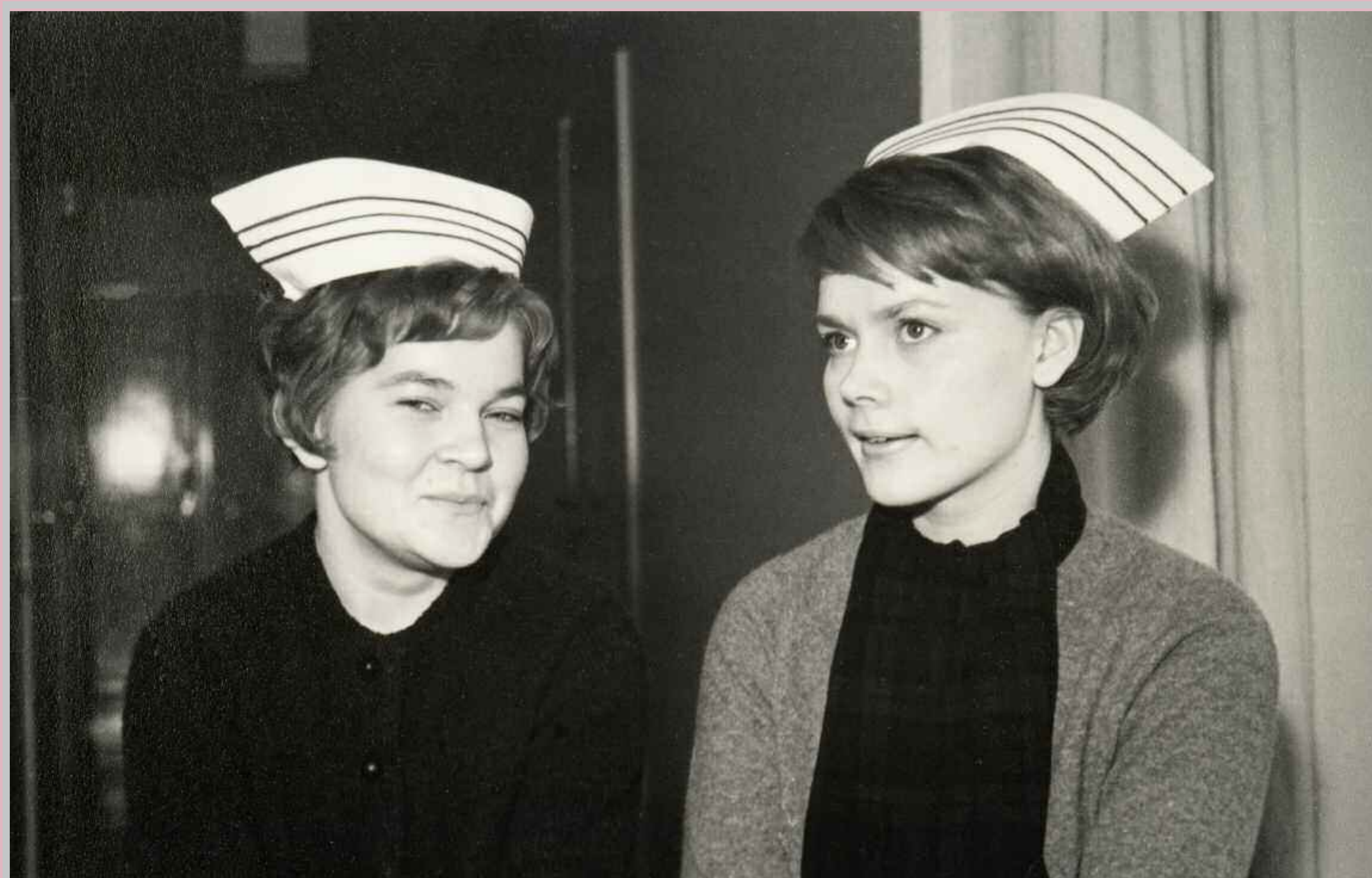
Hilka korvasi rusettimyssyn 1930-luvulla ja oli käytössä vuoteen 1971 saakka. Päähineet menettivät merkityksensä osana pukeutumista 1960-luvulla, ja sairaanhoitajan puku seurasi aikaansa. Opiskelijan puvusta hilka jätettiin pois jo vuonna 1965. Kuvassa 1960-luvun nuoret poseraavat kolmannen vuoden opiskelijan hilkat päissään.

”Det var inte lätt att få den vita tyglappen att likna en mössa, men man blir väl skickligare så småningom. Första årets mössa har ett blått band, andra årets två, tredje årets tre. Det är för att folk på avdelningen ska veta vad vi går för, vad de kan fordra av oss.”