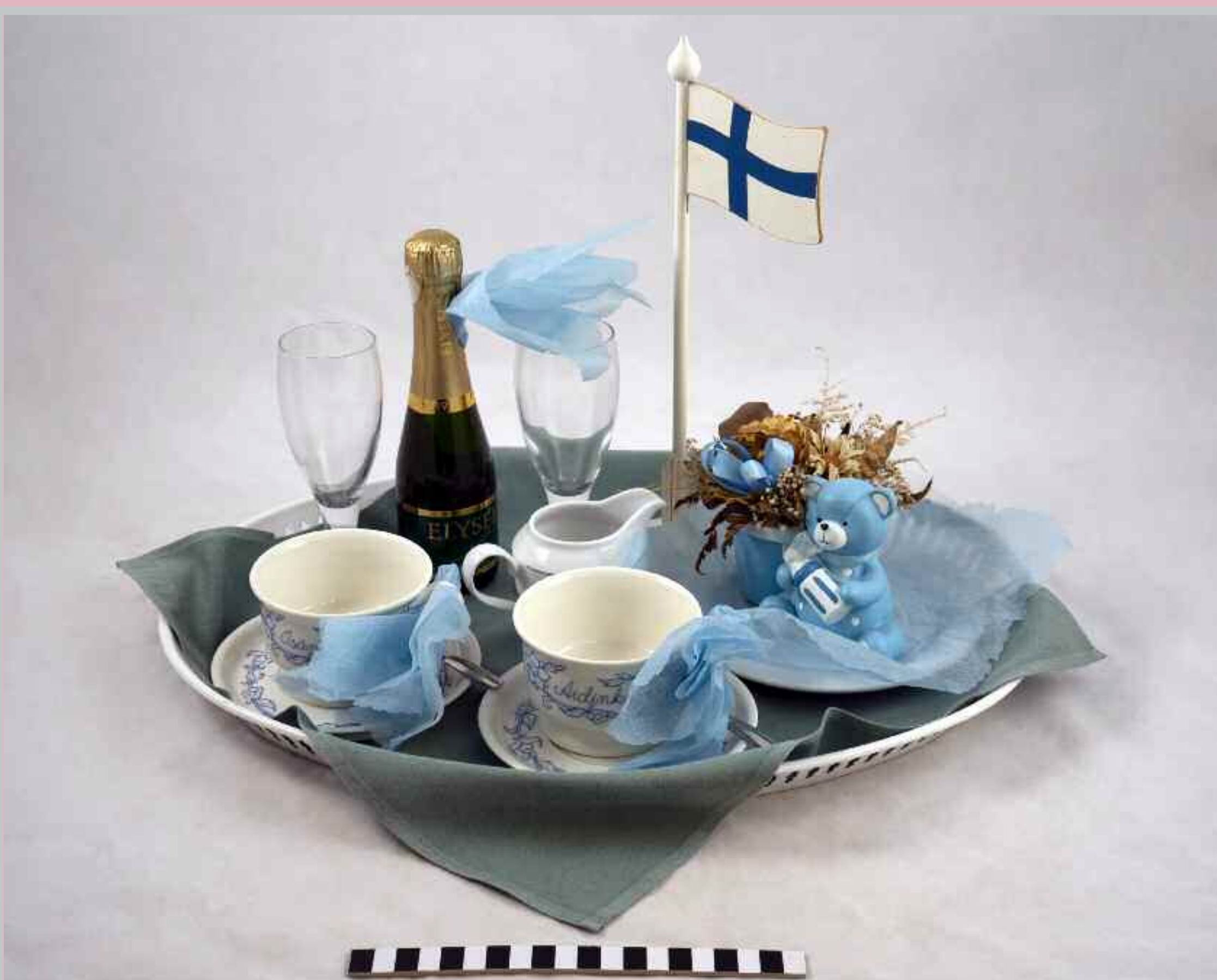
Länsi-Uudenmaan sairaalan synnytysosaston traditioon kuuluu 1990-luvulta lähtien juhlakahvien tarjoilu vastasyntyneen vanhemmille. Sairaalan synnytysosasto lakkautettiin vuonna 2010. Viime vuosikymmenten trendinä on ollut synnytysten keskitäminen suuriin yksiköihin. Matkasynnytysten riski kasvaa, mutta ctuna on moniammatillisen päivystävän tiimin valmius selviytyä hankalimmistakin tilanteista. Till traditionerna på Västra Nylands sjukhus BB-avdelning hörde från och med 1990-talet att fira föräldrar till den nyfödda med kaffeservering. Sjukhusets BB-avdelning lades ner år 2010. De senaste årtiondens trend har varit att koncentrera födselarna till större enheter. Risken för bilförlorningar ökar, men till fördelarna hör mångprofessionella jourteam som har beredskapen att klara av de svåraste av situationer.